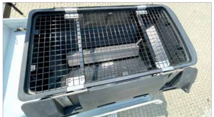
Förderschnecke mit Abdeckung